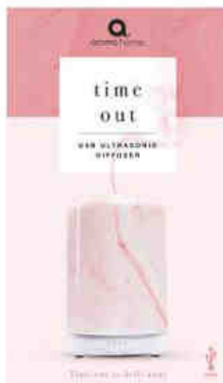
Difusor Tesla 550 ml

Product Dimensions: 14cm x 9.2cm x 9.2cm