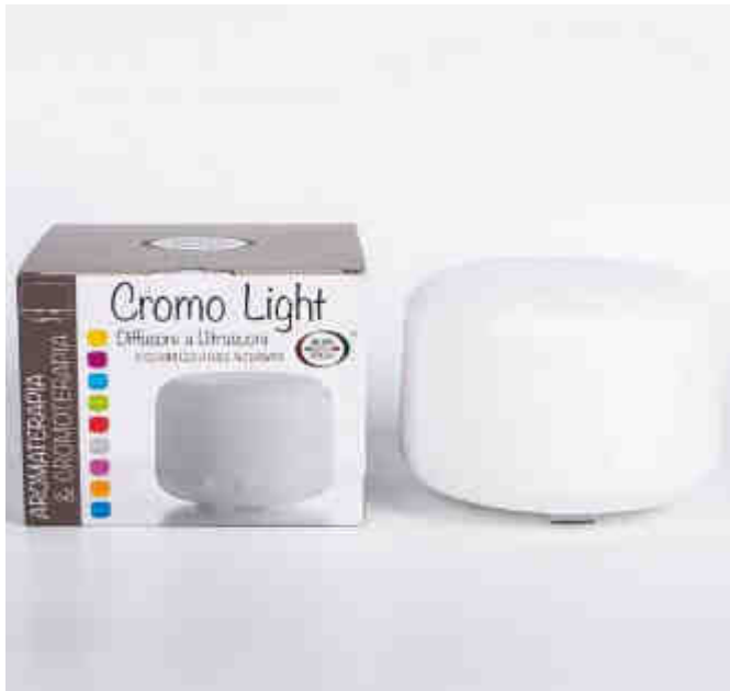
Difusor Cromo Light 500 ml