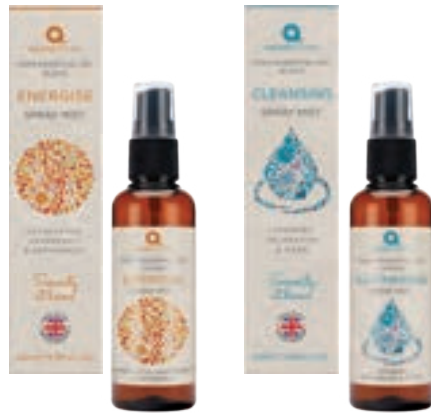
ENERGISING SPRAY MIST OIL-18-009 5060398128408